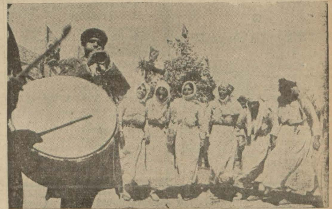
Çılgın bir sevinç içinde bayram yapan köylü kadınlar