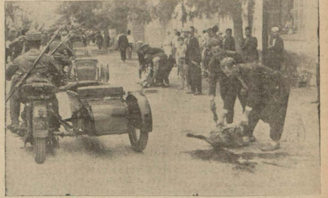
Askerlerimiz İskenderuna girerken kurbanlar kesiliyor