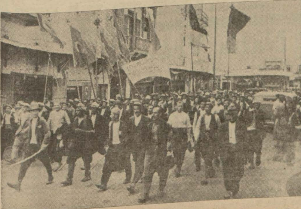
Askerlerimizi karşılamak üzere İskenderundan hududa akın eden halk