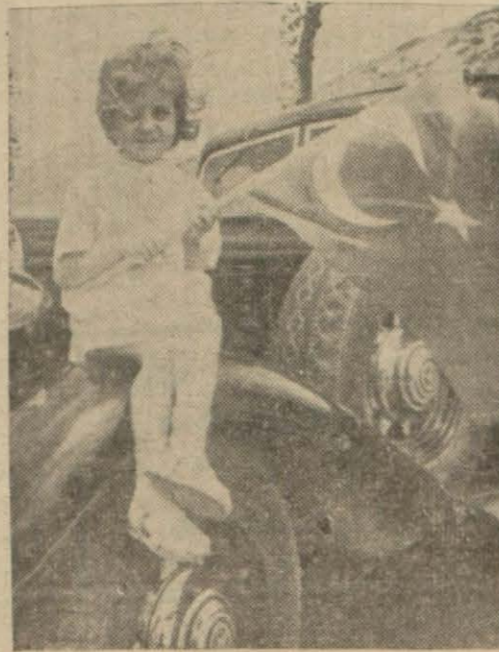
Büyük bayrak ve küçük yavru