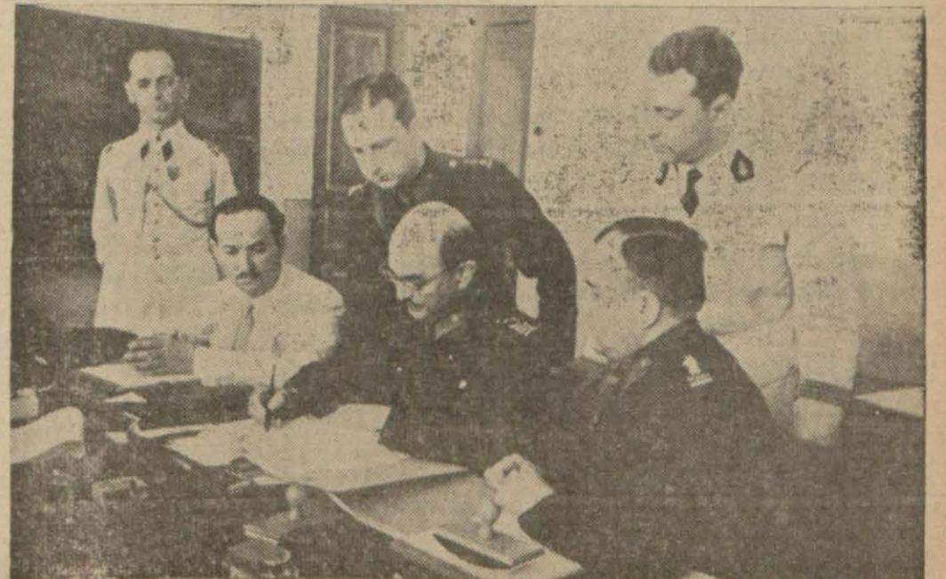
Askeri anlaşmaların imzasından bir intiba