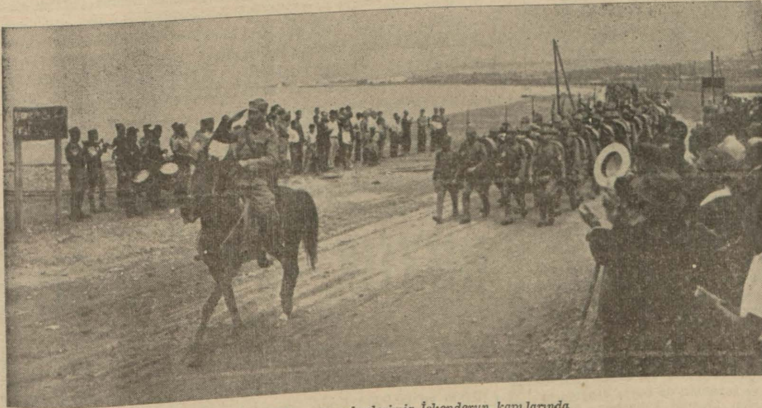
Kahraman askerlerimiz İskenderun kapılarında