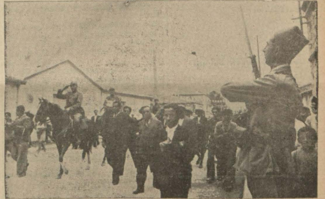
Askerlerimiz Hataya girerken Fransız nöbetçileri tarafından selâmlanıyor