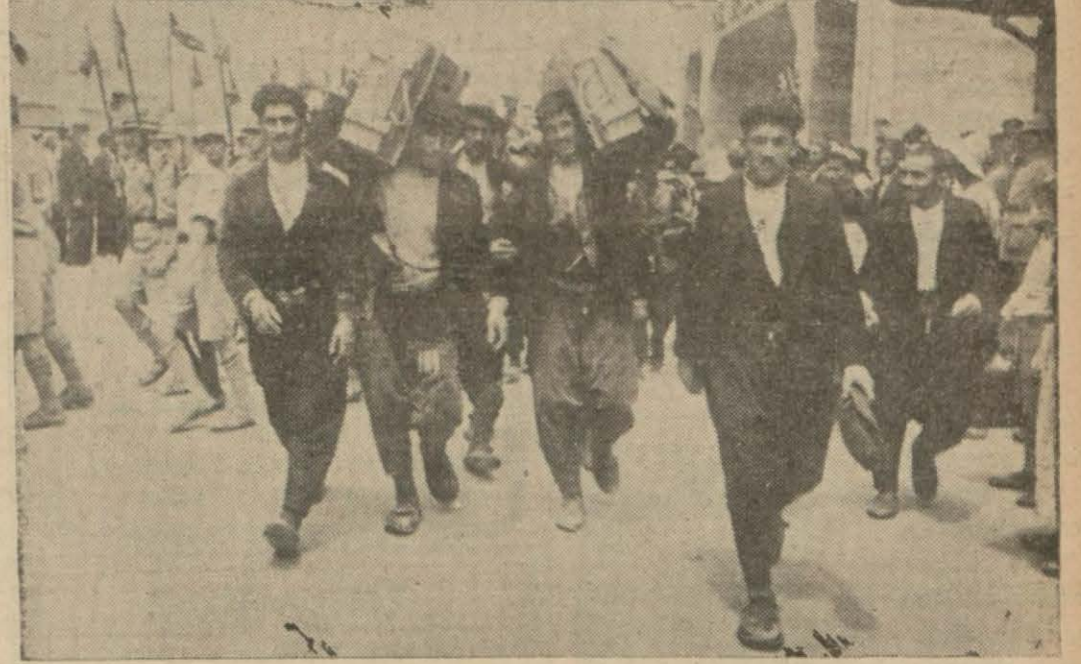
Askerlerin ağırlıklarını taşıyan halk