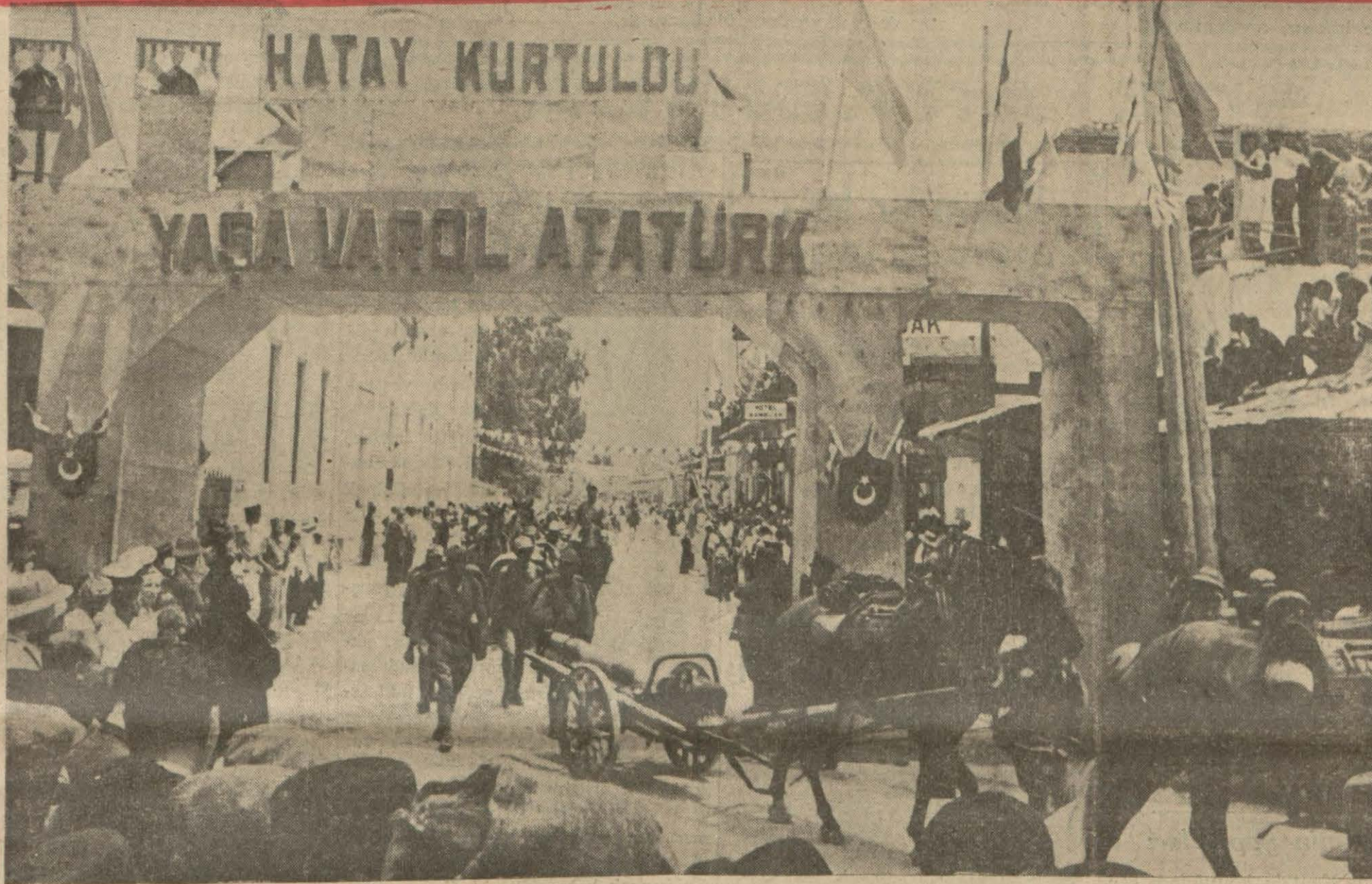
Kahraman askerlerimizin İskenderuna girişleri