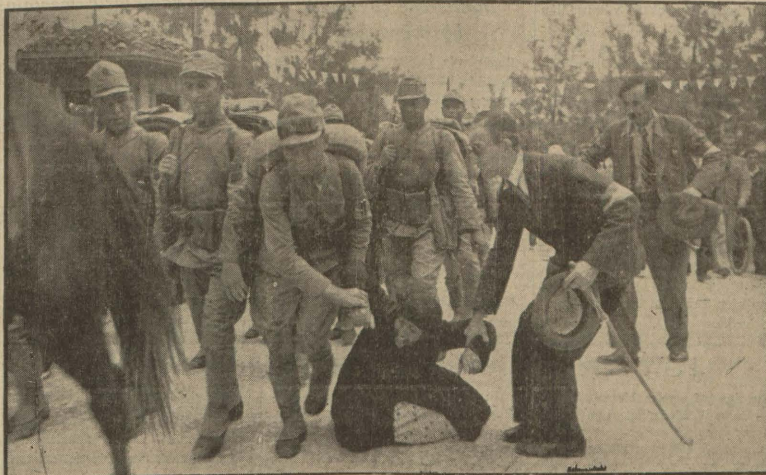
18 yıl süren hasretten sonra; Mehmedçiklerin ayaklarını öpmek üzere atılan Hataylı kadın

Siyahlar giyerek orduyu istikbale gelen genç kızlar askerlerimiz geçerken bu elbiseleri çıkararak kırmızı - beyaz renklere büründüler