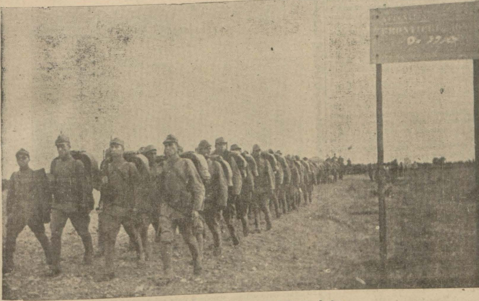
Kahraman askerlerimiz hududu geçerlerken